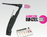
SR26L - 8 m 046184