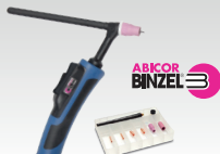
SR26DB - 4 m 038271