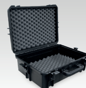
Stevige koffer IP67 voor «on site» lasklassen 060432