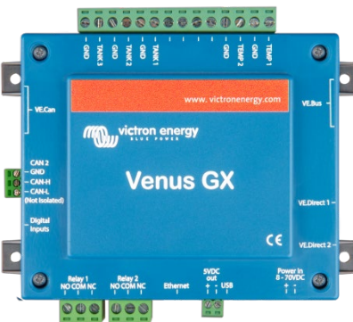
Venus GX met connectors