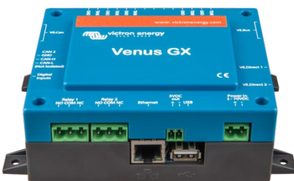
Venus GX voor aanzicht