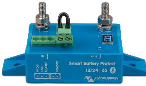
Smart BatteryProtect BP-65