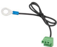
Connector met voorgemonteerde DC-minuskabel (inbegrepen)