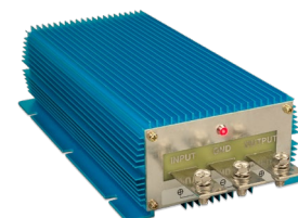
Orion IP67 24/12-100 Orion IP67 12/24-50