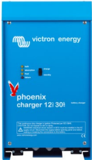
Phoenix Lader 12V 30A