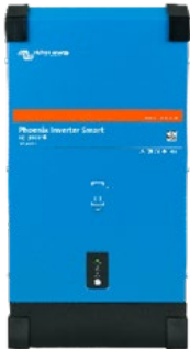
Phoenix Omvormer Smart 12/3000