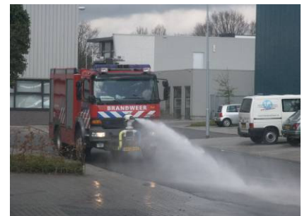
2 st. Mercedes Brw. Terneuzen/Borsele