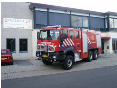
5 st. Iveco Regio Gelderland Midden